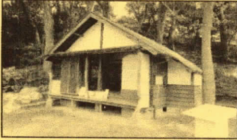
旧志賀直哉邸跡 書斎