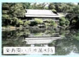
安寿園の池湧水時