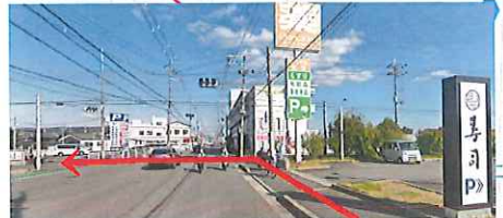
薬局の所で信号を 渡り集落の方へ左折

注) 氷室プロムナードは元水路で道路ではないため、 一般地図には記載されていません。