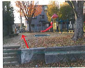
左手公園ぬけ道路に出る