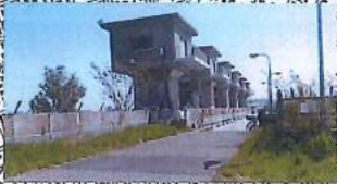
ショートコース 折り返し地点