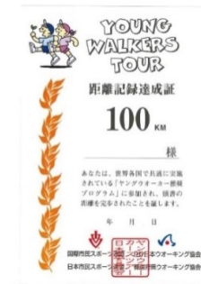
歩行距離合計 100km の認定証

参加回数が 10 回、25 回、50 回、75 回の子どもたちには、世界共通のメダルやワッペン（10 回目のみ）を贈呈しています。また、IVV-JAPAN は、歩行距離が 1,000 km に達した子どもたちを「子どもマスターウォーカー」として表彰しており、表彰状を進呈しています。