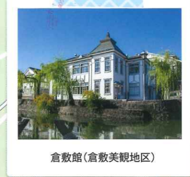
倉敷館(倉敷美観地区)