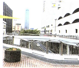
下関駅東口エキマチ広場から見える海峡ゆめタワー