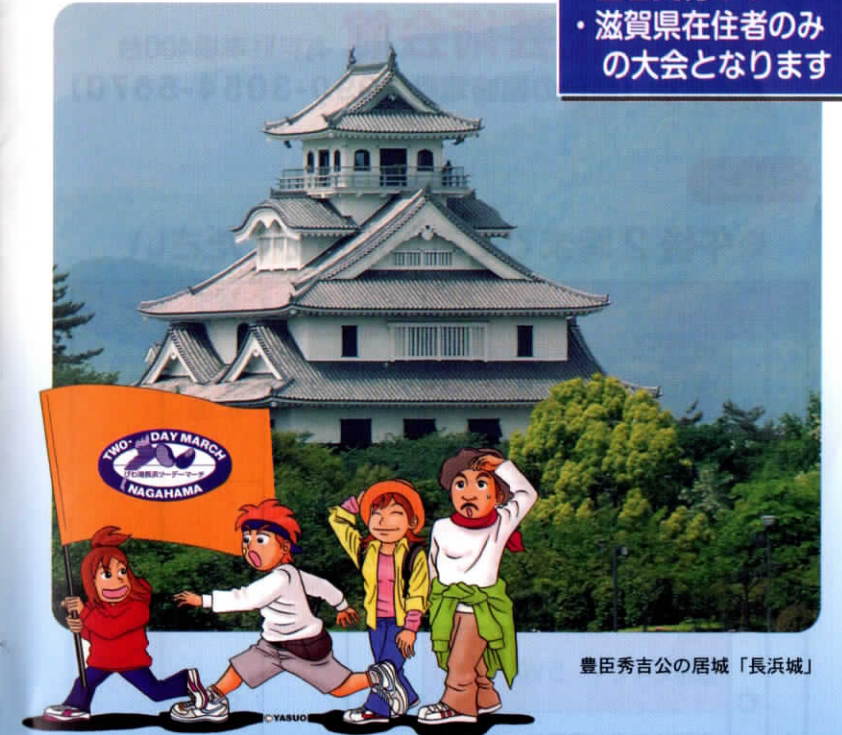
豊臣秀吉公の居城「長浜城」

主催 長浜市 (公財)長浜文化スポーツ振興事業団 (一社)日本ウォーキング協会 (NPO法人)滋賀県ウォーキング協会 朝日新聞社 主管 びわ湖長浜ツデーマーチ実行委員会 後援 滋賀県 滋賀県教育委員会 (公財)滋賀県スポーツ協会 びわ湖放送 (一社)全日本ノルディック・ウォーク連盟