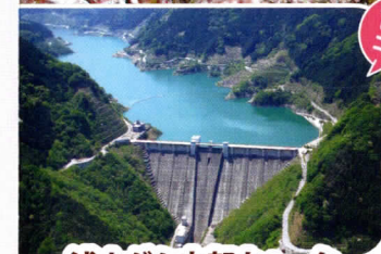
浦山ダム内部ウォーク