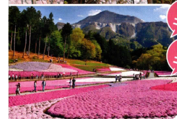
横瀬&羊山ぐるっと

魅力いっぱい! 歩くだけじゃもったいない!! 第19回 秩父いってんべえ ウォーキング 2Days 令和5年 4月22日(土)・23日(日) 募集要項