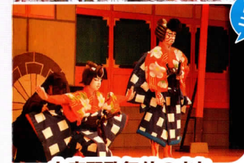
小鹿野歌舞伎のまち