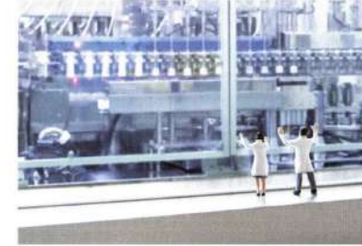
F012 全工場にクリーンルームを完備。医薬品レベルの環境で安全性・高い品質を守ります。

お客さまと真正面から向き合い、 目の前のひとりひとりに嘘のないものを。 私たちはお客さまに本当に必要とされるものを 自ら考え、生み出し、責任をもってお届けしていきます。