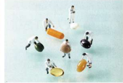
F067 薬とサプリメントの飲み合わせを日本で初めてデータベース化。お電話一本で調べます。

◎「正直品質。」を裏づける「ファンケル100の事実」。WEBでは、その全てを公開中です! www.fancl.jp/fact100