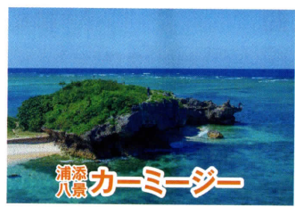
浦添八景 カーミー

琉球開びやくの始祖神アマミキヨが造った「おもろ」(神歌)にある。英祖王父祖代々の居城で、英祖には「太陽の子」の伝説がある。城跡は野面積みなどの古き趣きがある。