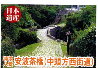
浦添八景 安波茶橋(中頭方西街道)

漆芸専門の全国初美術館であり、樹木の中にいくつもの八角塔を連ねている建物も個性的だと注目を浴びている。所蔵している葛飾北斎の描いた「琉球八景」は一見の価値あり。(年に1回の期間限定公開です。公開期間は予めご確認ください。)