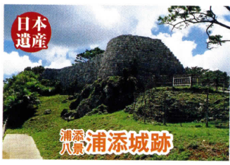
浦添八景 浦添城跡

2019年に沖縄県(浦添市・那覇市)のストーリー琉球王国時代から連綿と続く沖縄の伝統的な「琉球料理」と「泡盛」、そして「芸能」と、ストーリーを構成する文化財29件が文化庁の日本遺産に認定されました。「日本遺産」とは、地域の歴史的魅力や特色を有形・無形の様々な文化財で語るストーリーにし、文化庁が認定してその魅力を広く発信するとともに、人材育成・伝承・環境整備の取り組みを効果的に行い、地域の活性化を図ることを目的としています。是非、コース上に点在する琉球王国の礎を築いた浦添の歴史を体感してみてください。