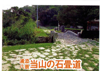
浦添八景 当山の石畳道

浦添丘陵の東端から少し離れた所に立つ巨岩。中南部からも見え、浦添のランドマークとなっている。根元には拝所があり現在も参拝者が多い。