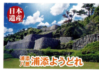
浦添八景 浦添ようどれ

首里城以前の中山の王城で、1260年代に英祖王が築いたと言われている。14世紀には高麗瓦ぶきの正殿を中心に、堀や石積城壁で囲まれた巨大なグスクとなり、首里城の原型となった。