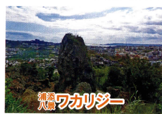
浦添八景 ワカリジ

浦添グスクの北側崖下にある王陵で、東室には尚寧王、西室には英祖王一族が眠っている。横穴式前面石積みの墓で、中には仏像や動物の浮彫のある大きな石棺も入っている。(2005年復元)