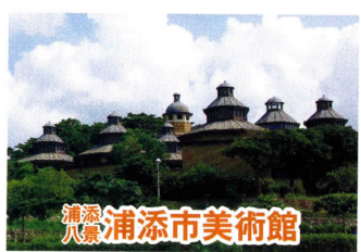
浦添八景 浦添市美術館

キャンプセンターの北端にある岬が空寿崎(くうじゅさき)。岬の先端は亀の甲羅の形をしていてカーミーと呼ばれている。一帯はイノーが広がり環境学習・自然体験の場として、市民にも親しまれている。