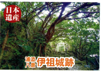
浦添八景 伊祖城跡

この道は古くは生活道路であったが、1671年宿道として整備された。道は、馬も転ぶという急坂を下り、牧港川の中流に架かる当山橋を渡ってまた登る。200mのS字型の石畳道は、普天間参詣道の一部となった。