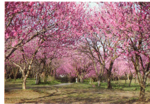
1,600本のはなももが咲き乱れる古河桃まつり (古河公方公園)