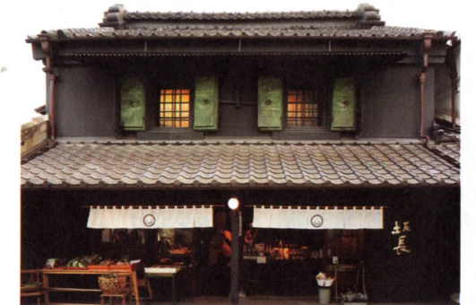
江戸時代から続く蔵を利用した店舗 (お休み処 坂長)