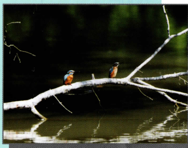
▲野鳥の楽園のカワセミ