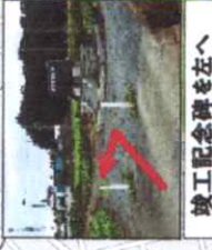
竣工記念碑を左へ