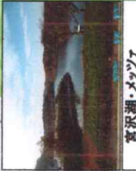
宮沢湖・メツツァ マークトホール前 5km地点