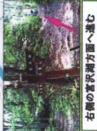
右側の宮沢湖方面へ進む